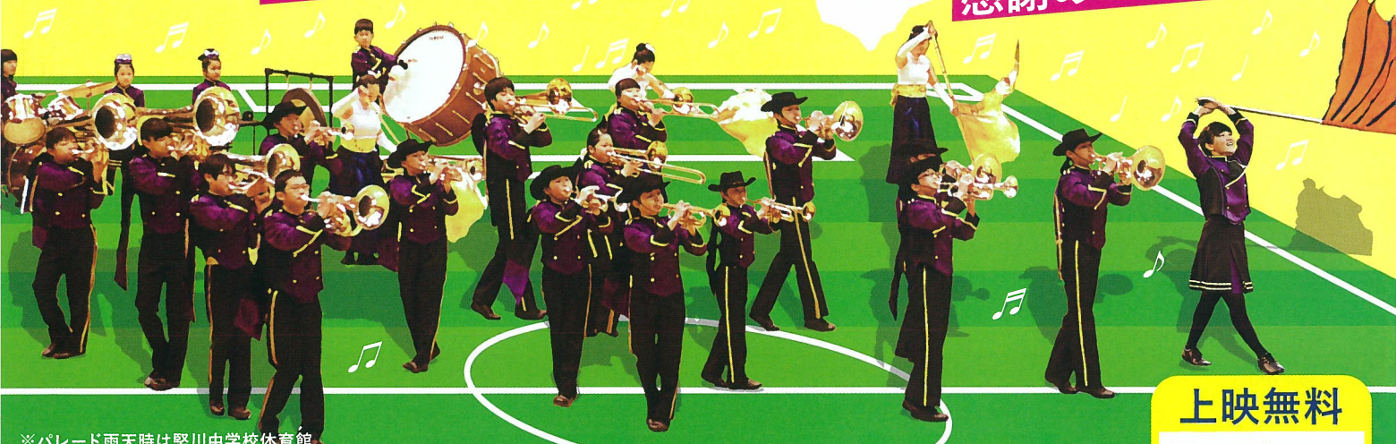
※パレード雨天時は堅川中学校体育館